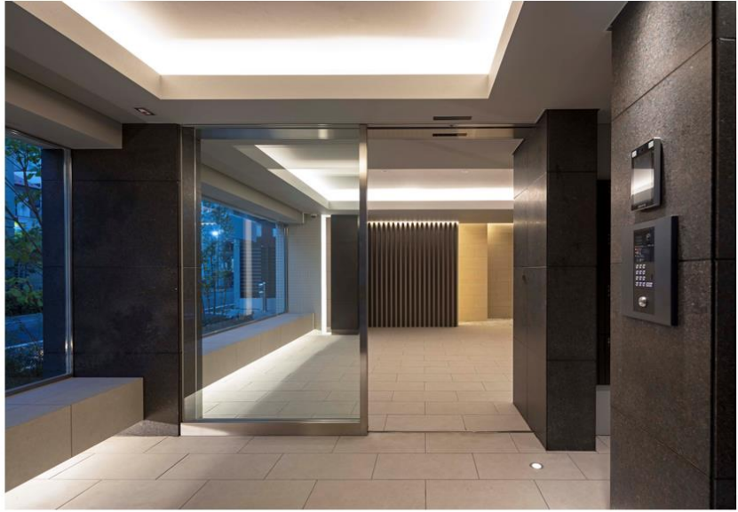
※ガリシアレジデンス松陰神社 現地写真